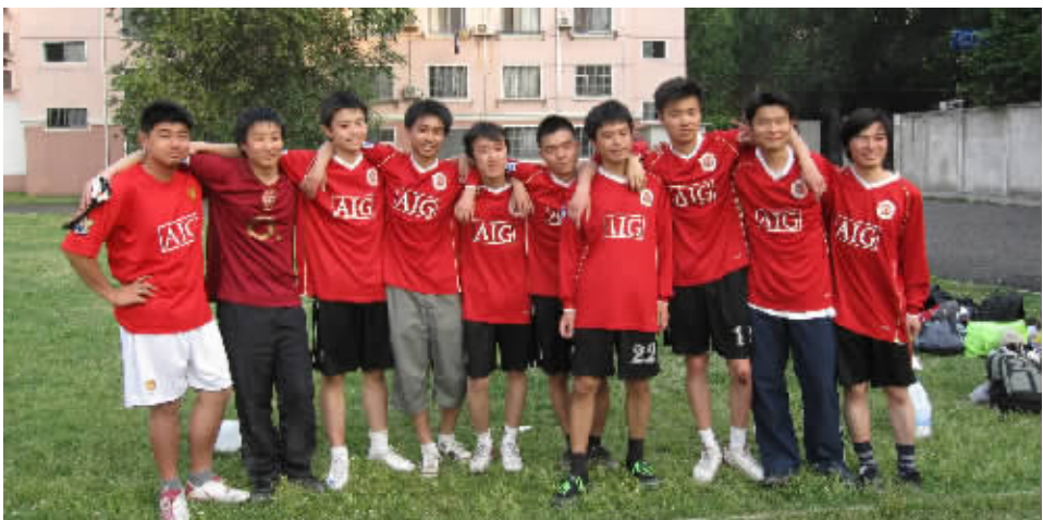
图为2009年毕业杯决赛05软件足球队全体队员 2009年5月24日于邯郸路球场