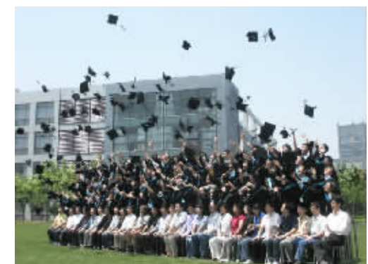
图为05软件学士服毕业照

在拍摄学士服集体照与毕业衫集体照之后,05软件同学互相合影留念。在这熟悉的校园中,在这亲切的系楼旁,入学伊始的一一张张稚嫩的面孔,已经因为多了成熟与收获而洋溢着自信和微笑。无论集体的学士服照、班衫照,或是同学之间、同学与师长之间的合影留念,记录下每一位同学对本科时光的眷恋,记录下同学间的情谊,记录下对师长的无限敬意与感激。