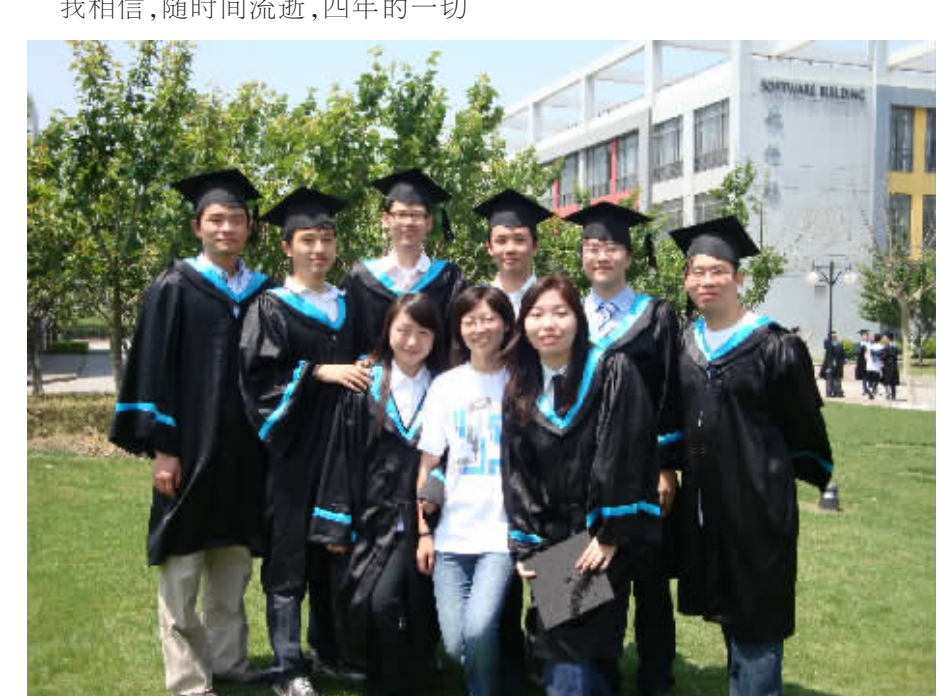
▲图为2005级软件学院部分同学毕业合影 2009年5月22日摄于张江校区草坪

我们展现了赢得胜利所需要的凌厉进攻和稳固防守;展现了身陷逆境所需要的顽强拼搏和锲而不舍;展现了热血男儿的气血方刚和无所畏惧;更展现了一个具有超强凝聚力的集体,即便是输,我们依旧不离不弃、互相扶持,依然为彼此加油呐喊。